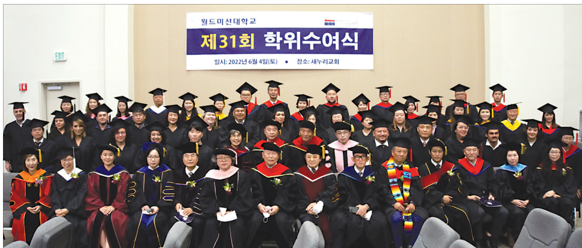
월드미션대학교 제31회 학위수여식

월드미션대학교(총장 임성진 박사)는 지난 4일, 남가주재누리교회에서 제31회 학위수여식 갖고 학부 졸업생 48명, 대학원 졸업생 51명 등 총 99명의 졸업생을 배출했다.