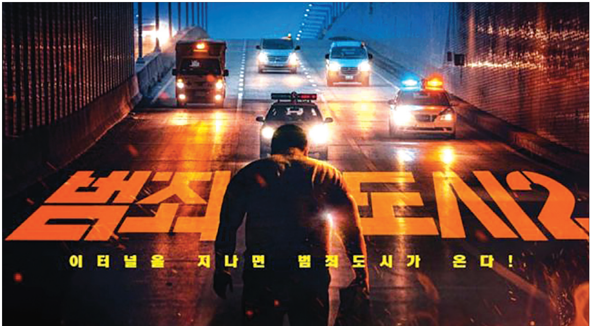
범죄자를 옹호하는 열혈 형사 마석도(마동석 분)의 일대기, <범죄도시 2>.

범죄로 인한 이득과 만족은 절대 오래 유지될 수 없으며, 범죄 행위를 저지른 자의 일생을 결국 파탄으로 몰아넣는다는 교훈