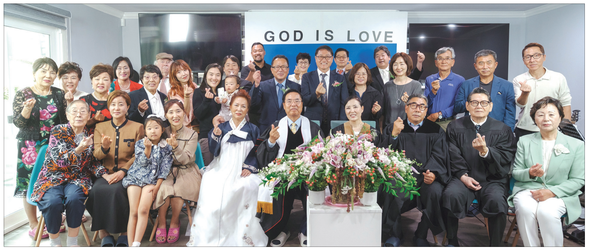
8주년을 맞은 LA씨티교회

씨니김 목사는 “LA씨티교회는 월서와 크렌셔의 LA한인타운 중심에 자리하고 있다”며 “우리 교회가 ‘마음을 만지는 사