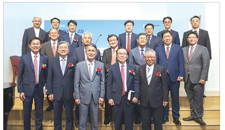
갈릴리선교교회 성전이전 및 봉헌예배에 참석한 목회자들

한 목사는 "갈릴리선교교회는 '영혼을 구원하여 제자 삼는 교회'의 사명을 가지고 있다"며 "2천년 전, 갈릴리 지역을 거니시며 제자를 부르시고 하나님 나라의 씨앗을 뿌렸던 예수님을 생각하며 영혼을 구원하고 제자를 삼