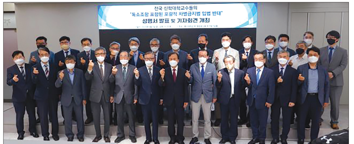
이번 성명에 참여한 교수들은 총신대, 합신대, 고신대, 국제신대, 장신대, 백석대, 성결대, 개신대, 수원신학원, 영남신대, 칼빈대, 평택대, 서울신대, 한국침신대, 대신대 등 교단과 교파를 망라했다.

셋째로는 “우리는 인간을 남자와 여자로 창조하신 하나님의 창조 질서와(창 1:27) 양성평등을 명시한 헌법(제36조)에 근거하여, 남성, 여성 이외에 개인의 취