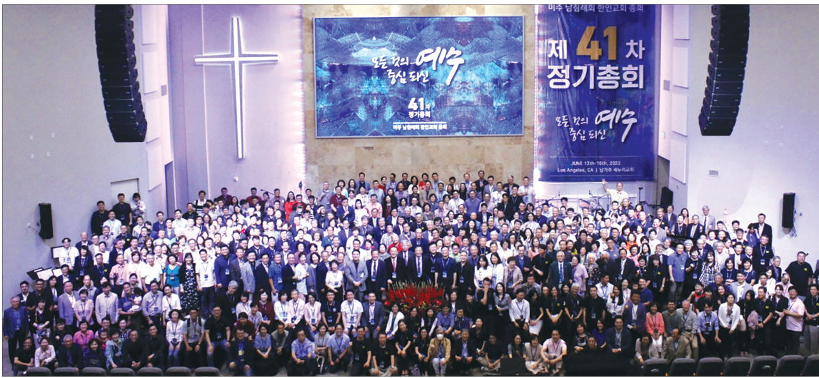
남가주 새누리교회에서 개최된 제41차 미주 남침례회 한인교회 총회 기념 촬영

제41차 미주 남침례회 한인교회 총회가 6월 13일(월)부터 15일(수)까지 “모든 것의 중심되신 예수”라는 주제로 남가주 LA 코리안타운에 소재한 새누리침례교회(담임 박성근 목사)에서 개최됐다. 총회는 과거 미주 남침례회 한