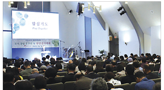
좋은비전교회 헌당 감사 예배 마지막 순서로 합심 기도하는 좋은비전교회 교인들

좋은비전교회(담임 최준우 목사)는 지난 5일, 교회 설립 3주년 및 헌당 감사 예배를 드리고, 모든 것이 오직 하나님의 은혜임을 고백했다.