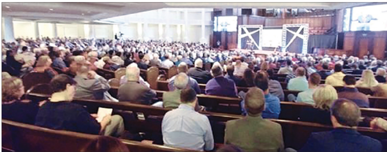
2018년 11월 조지아주 마리에타에 위치한 벨연연합감리교회에서 열린 웨슬리안연합회의의 글로벌 회의 모습.

베일러대학교 조지 W. 트루렛 신학대학원의 웨슬리하우스 연구 책임이자 텍사스 와코 제일